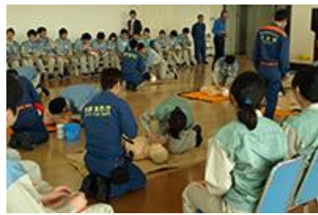
新入社員の普通救命講習