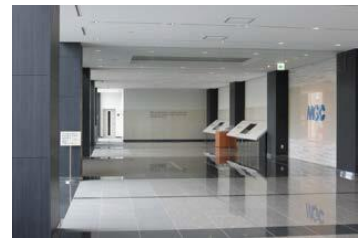
東京テクノパーク 内部