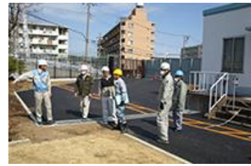
協力会社と月例パトロール