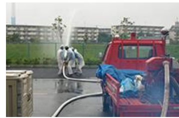
消防ポンプ車の放水訓練