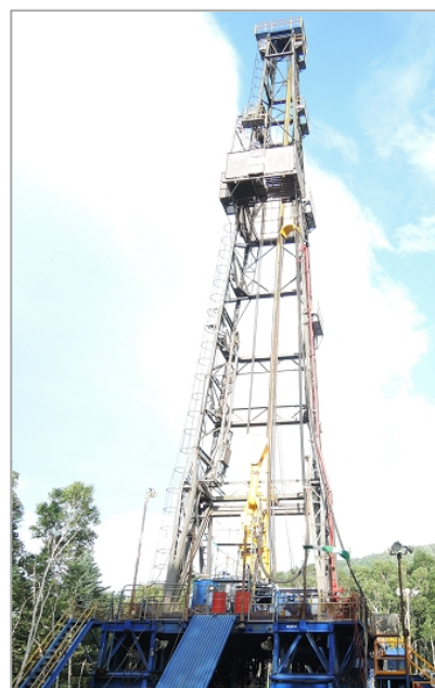
構造試錐井「武佐岳 むさだけ SMMG-1D号井」 の掘削作業風景