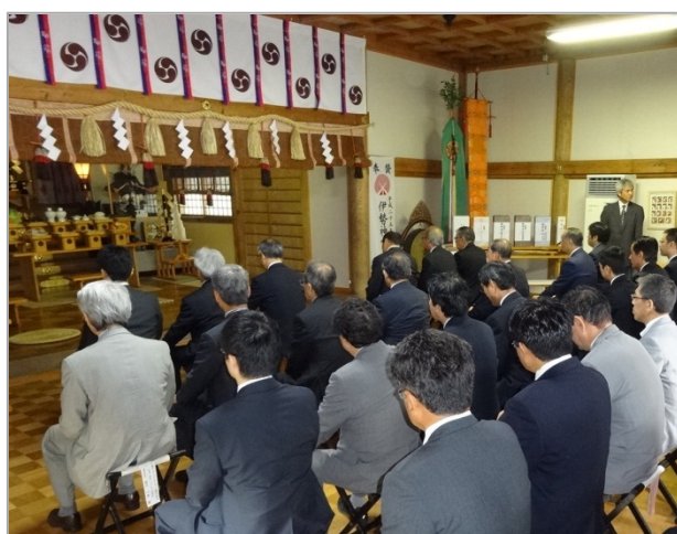
安全祈願神事の様子（8月23日、標津神社）