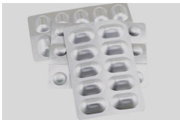
脱酸素ブリスター