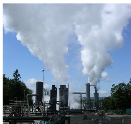
長期噴気試験の様子

※ …… 約 4 年程度と長期にわたる従来の環境アセスメント手続期間を、短縮するための実証事業。